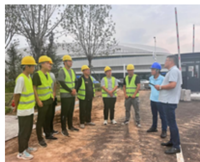
公司与一线员工现场办公