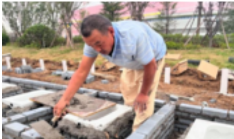
晚餐时间在值班的劳务工人

现场目前处于土方开挖及基础施工阶段，项目部合理安排交叉施工，提前组织管道、砌块、水泥砂浆等材料进场。同时安排土方机械24小时不间断作业，场地开挖整平后，立即安排工人进行垫层浇筑及砖胎模砌筑；管沟开挖完成后，组织分段夯实，为管网施工创造工作面。为保证项目快速推进，在项目抢工期间，劳务人员始终坚持轮流吃饭，留人值班，最大限度保证了项目现场的施工进度。同时，延长工作时间，开启夜间施工，力求保证关键节点，以高质量、高标准完成建设任务。