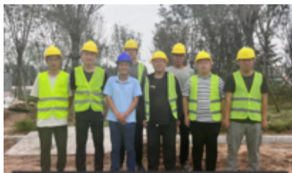
青春足球场项目团队

青春足球场项目立为满足公司全局战略规划、人才培养、队伍建设等方面需求，所以准备周期长，推进速度慢。为加快项目建设进度，项目开工后，项目管理团队立即组织人员、机械进场，严格按照集团要求针对安全、质量进行深入交底，并排布详细的施工计划，合理有序地统筹现场工作。同时，针对现存问题，深入分析项目推进中存在的问题和原因，理顺需要协调解决的各项事项，精准施策，带领建设团队员工团结一心，全力以赴，始终以“抢节点，保交付”作为工作重心。